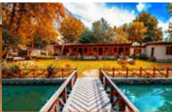
5* 塞琳娜希加爾堡酒店