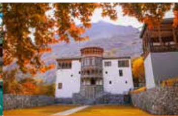
5* 塞琳娜卡普魯堡酒店