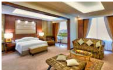
5* 伊斯蘭馬巴德萬豪酒店